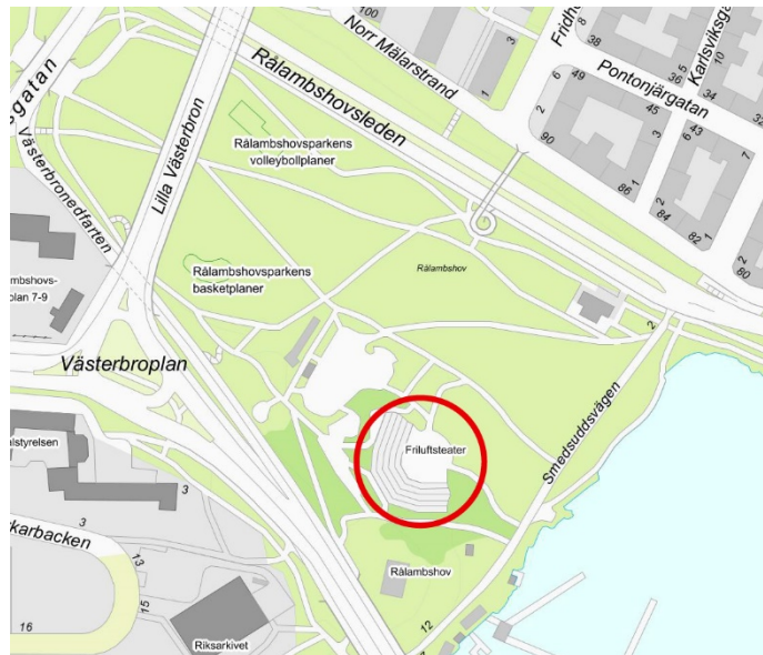
Figur 1 - Karta som visar amfiteaterns placering i Rålambshovsparken.

in i landskapet, samtidigt som det skapas en viss visuell avskärmning från parkens centrala delar.